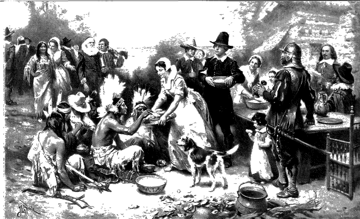
Schilderij over de eerste Thanksgiving in 1621 Geschilderd door Jean Leon Gerome Ferris in 1932.

betrouwbaarheid van de bron kunnen uitleggen. De tweede HAT gaat over de Vietnamoorlog waarbij leerlingen moeten aangeven hoe bruikbaar een interview met de toenmalige Amerikaanse minister van Defensie is voor het verklaren van de Amerikaanse nederlaag. Het belangrijkste doel bij deze HAT is dat leerlingen het feit selecteren dat onthult dat de minister van Defensie (Melvin Laird) de schuld voor de Amerikaanse nederlaag in Vietnam wilde vermijden door de Zuid-Vietnamese troepen af te schilderen als onvoldoende toegewijd aan de strijd.