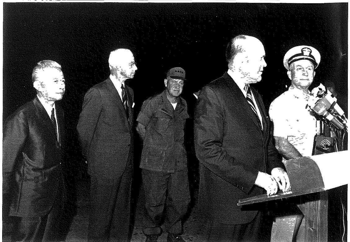
Minister van Defensie Melvin Laird spreekt de pers toe in Saigon, 1971.