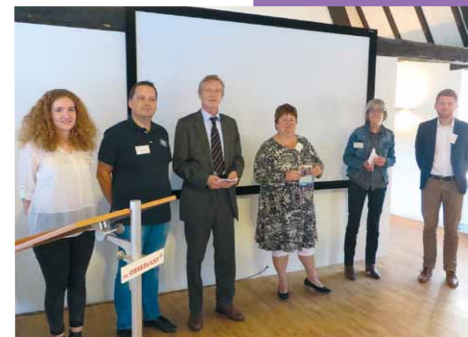
Studenten reiken de eerste boekjes uit op een landelijke conferentie

Wilt u meer weten? Op www.rug.nl/wewi-gedeelde-literatuur vindt u alle deelvragen en leest u hoe u het boekje Gedeelde literatuur kunt bestellen.