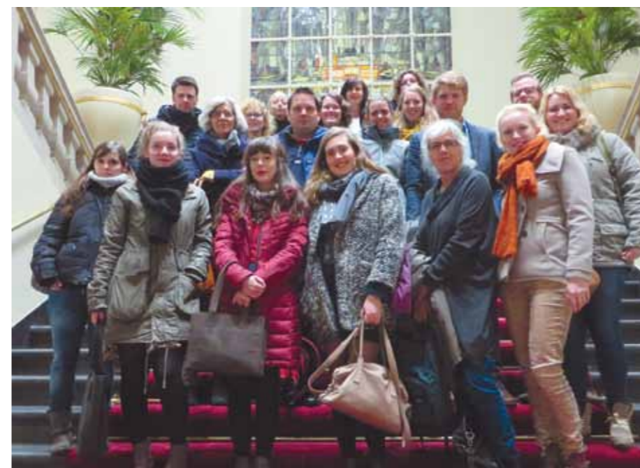
Masterstudenten gingen op onderzoek uit in de wereld van leesgroepen

Geheel in wetenschapswinkelstijl werkten we in Gedeelde literatuur met studentonderzoek. Dankzij de Alfa Meerwaarde-subsidie kon er dit keer echter een speciaal interdisciplinair onderzoekscollege opgezet worden, waarbij vertegenwoordigers van Senia en de bibliotheken ook een aantal malen aanschoven. De wetenschapswinkel ondersteunde het proces. Het contact