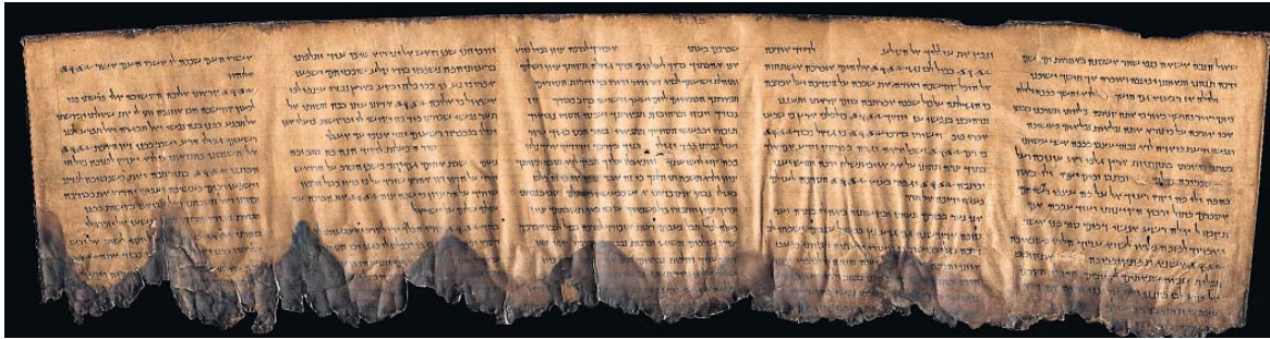
▲ De Psalmenrol is een van de boekrollen die vanaf 9 juli te zien zijn in het Drents Museum in Assen. Onder: Herstelwerkzaamheden aan een boekrol in het laboratorium van de Israëliëse oudheidkundige dienst in Jeruzalem.