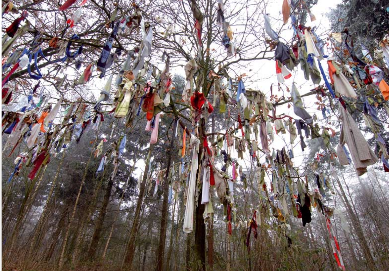
Koortsboom (Overasselt), om genezing af te smeken met lapjes van ernstig zieken