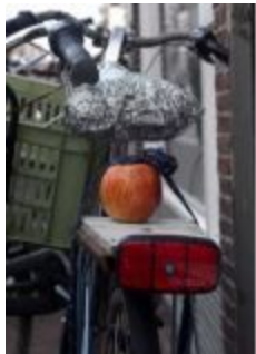
Boven: pagina 160; 'Appeltje voor de Dorst', Bert Otten (2011)