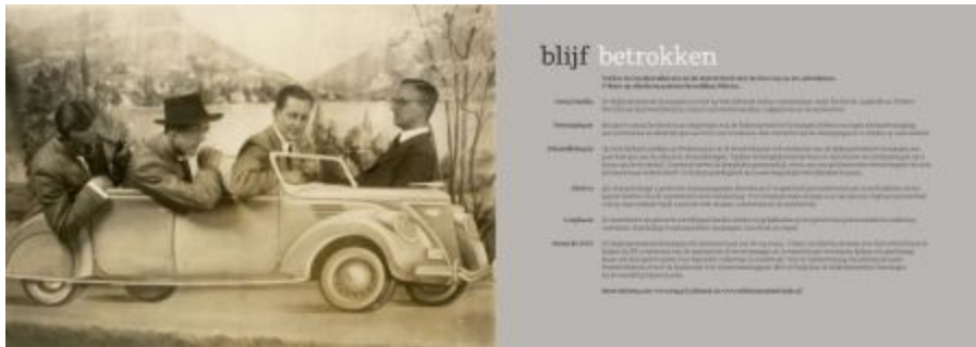
Boven: pagina 154 en 155; Foto: Vier studenten, gefotografeerd in studio fotograaf met auto als coulis, 1937. Opschrift: 'Kermis'. Collectie Universiteitsmuseum Groningen, D. Cannegieter [009840]