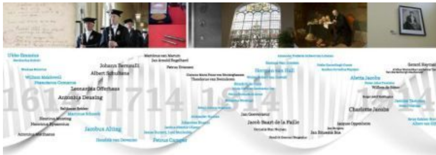
Boven: pagina 42 en 43; van links naar rechts:

Detail van de eerste bladzijde van het inschrijvingsregister van de Academie, het Album Academiae . De officiële inschrijving begon op 13 maart 1615 en op die dag meldden zich 27 studenten. [toegang 46, inv.nr.43]