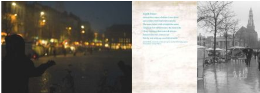
Boven: pagina 38 en 39; Foto links: 'Eerste Sneeuw', Vismarkt, Bert Otten (2012) Gedicht: Akerkstraat, Martin Bril (columnist, schrijver, dichter, studeerde wijsbegeerte), vertaling Jenny Wilson Foto rechts: 'Regen', Vismarkt, Bert Otten (2012)