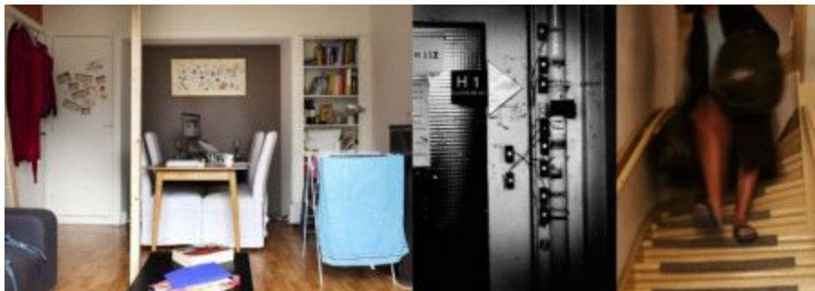
Boven: pagina 56 en 57;