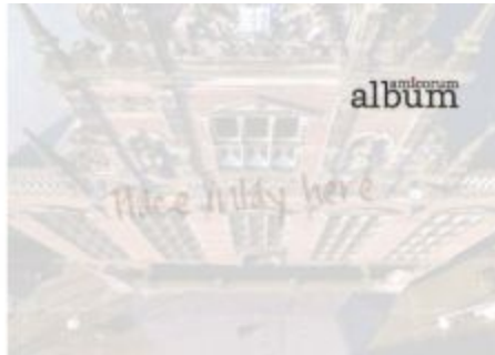
Boven: pagina 1; detail Academiegebouw ; Eric Kieboom (2011)

In 2014 is er een nieuw Album uitgegeven, met volledig nieuwe foto's, afbeeldingen en teksten. Hieronder wordt het nieuwe Album per pagina toegelicht.