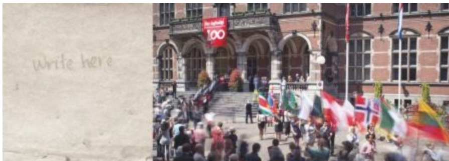
Boven: pagina 8 en 9; Academiegebouw/Broerplein, uitreiking eredoctoraten ter ere van het 400-jarig bestaan van de universiteit , Martin Roemers (2014)