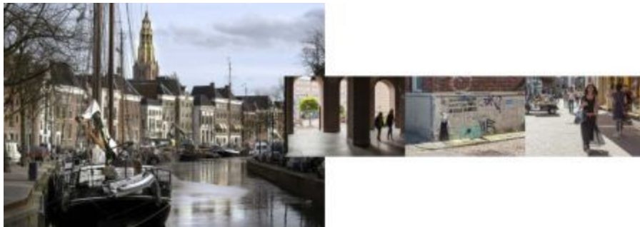
Boven: pagina 20 en 21;