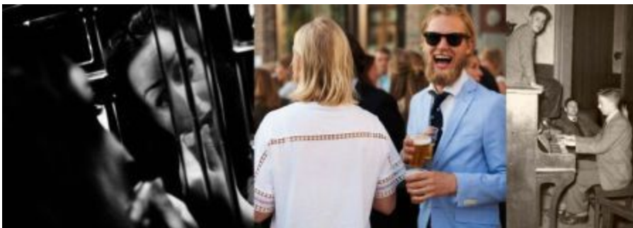
Foto rechts: The Kytoman Orchestra , Eurosonic/Noorderslag , Grote Markt, Bert Otten (2013)

Foto midden: Nachtleven , Dirk-Jan Visser (2014)