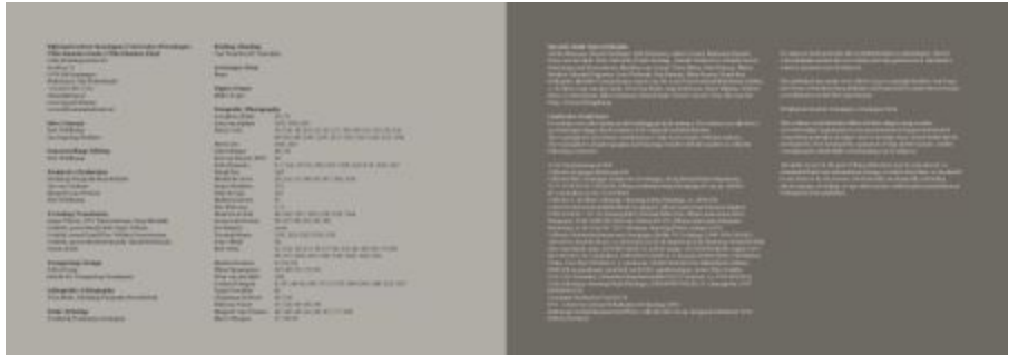
Boven: pagina 158 en 159; colofon