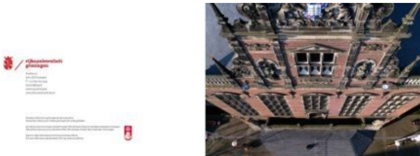
Boven: pagina 2 en 3; detail Academiegebouw ; Eric Kieboom (2011)