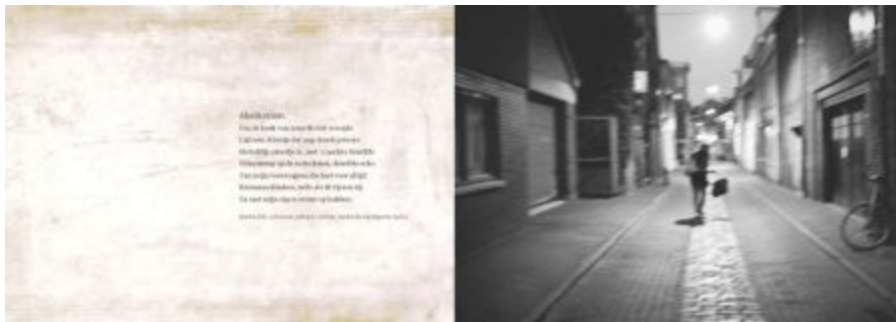
Boven: pagina 36 en 37; Gedicht: Akerkstraat, Martin Bril (columnist, schrijver, dichter, studeerde wijsbegeerte) Foto: Nachtleven, Dirk-Jan Visser (2014)