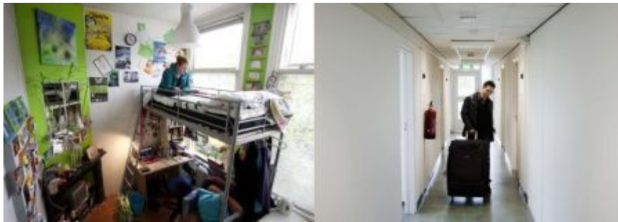
Boven: pagina 66 en 67; Foto links: Studentenkamer, Jeroen van Kooten (2011) Foto rechts: Studentenflat, Jeroen van Kooten (2011)