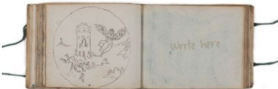
Boven: pagina 6 en 7; pagina's uit het album amicorum van Harmen Jarghes (gebruikt tussen 1608 en 1628), collectie Universiteitsbibliotheek Groningen . Bekijk hier het hele album .