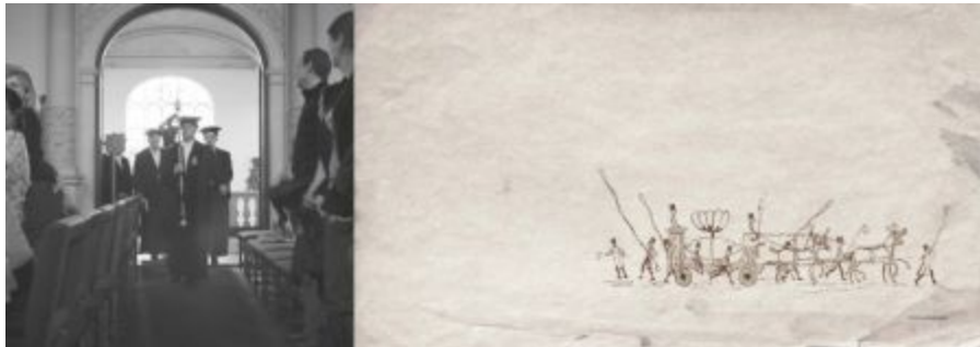
Boven: pagina 144 en 145;