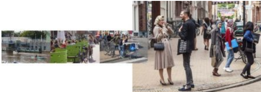
Boven: pagina 18 en 19;