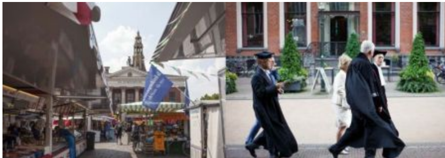
Foto rechts: Herestraat

Afbeelding links: Groeninga, Georg Braun/Frans Hogenberg, 1570-1590, de stad Groningen vanuit het noorden gezien