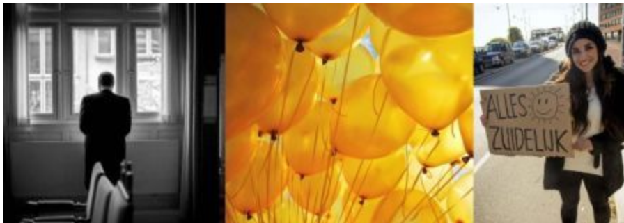
Boven: pagina 146 en 147;