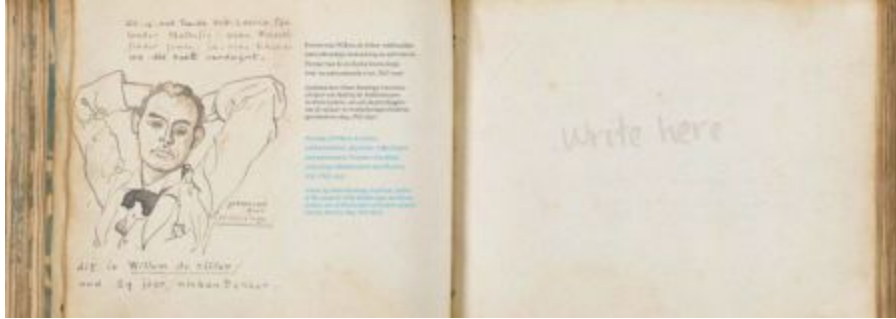
Boven: pagina 64 en 65; Portret uit ca. 1896 van Willem de Sitter , wiskundige, natuurkundige, kosmoloog en astronoom. Pionier van de moderne kosmologie. Getekend door Johan Huizinga , historicus en een van de grondleggers van de cultuur- en mentaliteitsgeschiedenis. Collectie A. de Sitter.