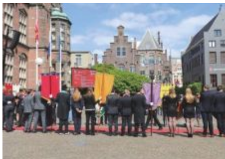
Foto rechts: Bernoulliborg , faculteit Wiskunde en Natuurwetenschappen, Jeroen van Kooten (2009)

Foto's links: Zernike Campus , Jeroen van Kooten (2009); binnenplaats faculteit Godgeleerdheid en Godsdienstwetenschap , Elmer Spaargaren ; uitzicht vanuit Bernoulliborg op Linnaeusborg , faculteit Wiskunde en Natuurwetenschappen / Levenswetenschappen, Harry Cock (2014); Studentenrechtbank , Michel de Groot (2007); Duisenberggebouw , Harry Cock (2014); Aletta Jacobshal Michel de Groot (2010); Bernoulliborg , Harry Cock (2014); Duisenberggebouw , Harry Cock (2014); archeologie, Elmer Spaargaren (2013)