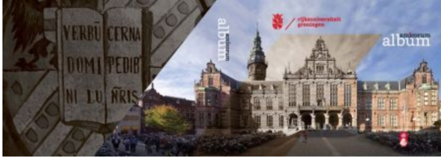
Vorkant Album Amicorum; Academiegebouw