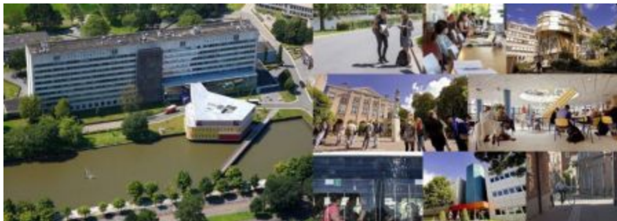
Boven: pagina 50 en 51; Foto links: Duisenberg Gebouw, Faculteit Economie en Bedrijfskunde, Zernikecomplex, Aerophoto Eelde (2012) Foto's rechts: Zernikecomplex, Harry Cock (2014); St udieruimte, Harry Cock (2014); Heymansgebouw, Faculteit Gedrags- en Maatschappijwetenschappen, Michel de Groot (2012); Harmonie complex, Faculteit der Letteren en Faculteit Rechtsgeleerdheid, Michel de Groot (2010); Kantine Faculteit der letteren, Michel de Groot (2010); Bus, Harry Cock (2014); Faculteit Ruimtelijke Wetenschappen, Michel de Groot (2010); Lutkenieuwstraat, Harry Cock (2014)