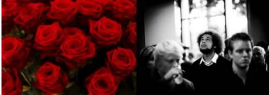
Boven: pagina 152 en 153; Foto links: Rozen , fotograaf onbekend Foto rechts: Opening Academisch Jaar, Faculteit Economie en Bedrijfskunde , Gerhard Taatgen (2011)